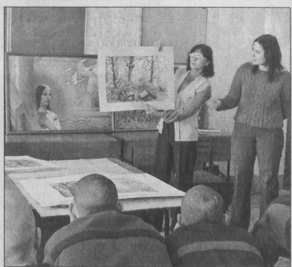
Воспитанников колонии знакомят с искусством.

Осужденных Мариинской воспитательной колонии научили... делать куклы. Мастер-классы по изготовлению куклы и рисованию прошли в рамках реализации проекта «Развитие творческого потенциала детей с ограниченными возможностями как популяризация памятника наскального искусства «Томская писаница».