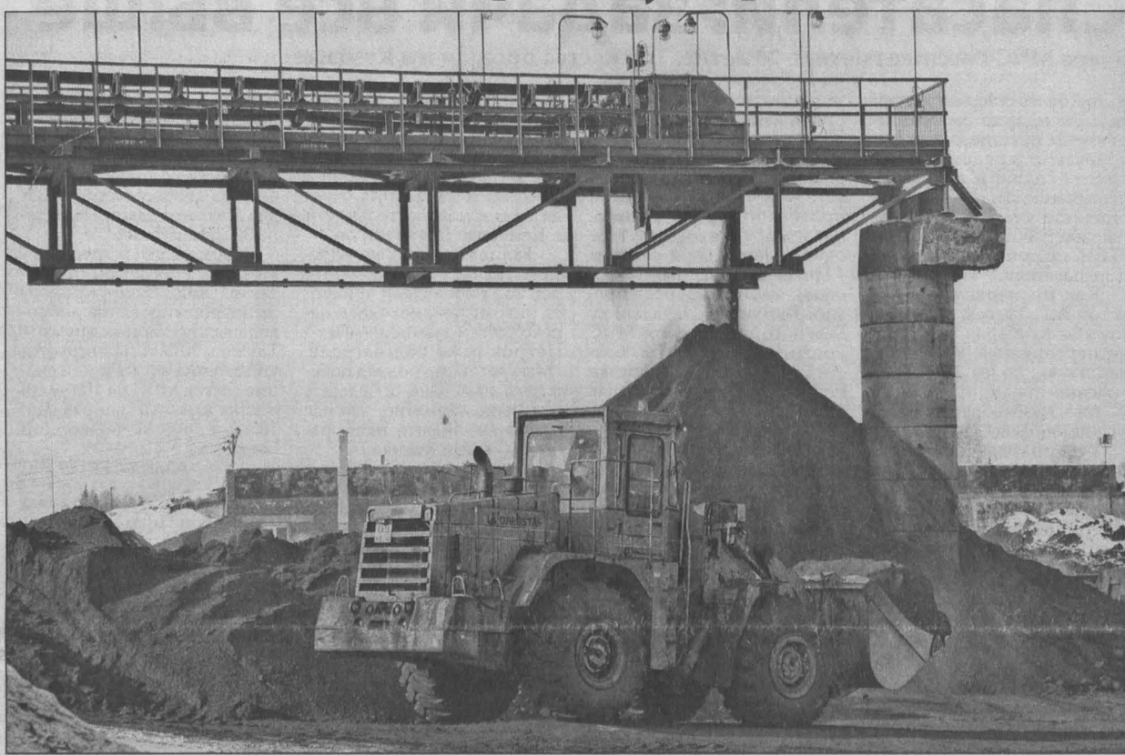
Запасов угля на складах для потребителей хватит. Сегодня главное – безопасность шахтеров.

О том, что в последние дни уходящего года велика вероятность сейсмических явлений, из-за которых можно ожидать изменений электростатического режима горных пород и выделения метана, предупредили сейсмологи. Как следствие, по мнению ученых, нельзя исключить землетрясение и взрывы метана в шахтах. Областные власти посчитали необходимым довести эту информацию до угольщиков, предложив принять особые меры безопасности к ведению горных работ. Вчера с таким же предложением к угольщикам сразу трех регионов – Кемеровской области, Алтайского края и Республики Алтай – вышло Южно-Сибирское управление Ростехнадзора. В его официальном сообщении говорится, в частности, следующее: «Предлагается рассмотреть вопрос о возможности приостановления добычи угля в