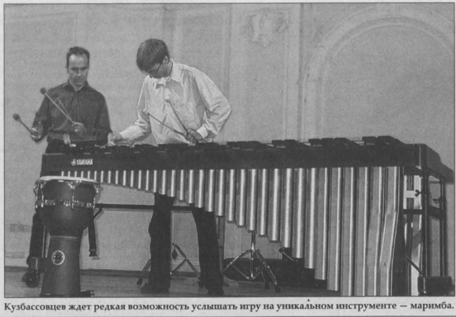
Кузбассовцев ждет редкая возможность услышать игру на уникальном инструменте — маримба.

Сегодня в Кемеровской государственной областной филармонии им. Б.Т. Штоколова состоится гала-концерт межрегионального фестиваля «Молодые таланты России».