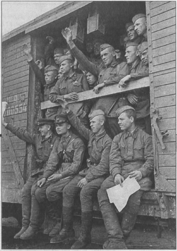
Советские воины отправляются на фронт (1941).