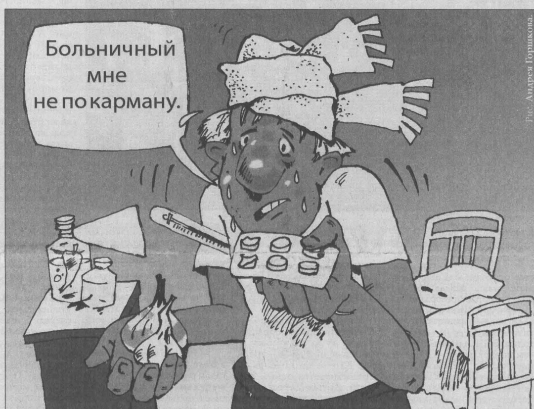
Рис. Андрей Горшков.

С 2007 года пособие по временной нетрудоспособности начисляется не за пропущенные рабочие дни, а за календарные. Иначе говоря, тому, кто работает месяц, оплачивают 20-22 рабочих дня, а тому, кто болеет, все 30. По мнению руководства Минздравсоцразвития, подобная схема не просто демотирует людей к возвращению