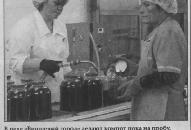
В цехе «Вишневый город» делают компот пока на пробу.