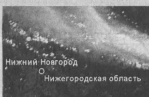
Нижний Новгород Нижегородская область

Президент России Дмитрий Медведев подписал приказ о введении режима чрезвычайной ситуации в семи регионах, где продолжаются лесные пожары. В огне погибли уже 40 человек, без крова над головой остались тысячи. Пожары продолжают бушевать, ежедневно происходят сотни новых возгораний. Чрезвычайная ситуация объявлена в Марий Эл, Мордовии, Владимирской, Воронежской, Московской, Нижегородской и Рязанской областях. К туше-