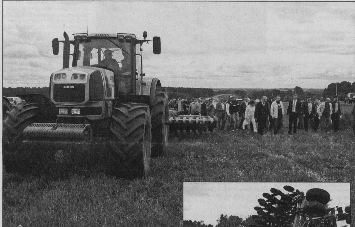
Гурьевский район «потерял» за год 442 коровы, Кемеровский - 548, Новокузнецкий - 408, Прокопьевский - 422, Промышленновский - 465, Юргинский - 408, Яшский - 344 коровы. (Окончание на 2-й стр.) НА СНИМКАХ: полевые учения; во время выставки современной сельхозтехники.

Невеселым случился традиционный областной семинар-совещание по заготовке кормов, который прошел в Топкинском районе. К проблеме отсутствия цены и спроса на зерно урожая прошлого года добавились достаточно нерадостные прогнозы на урожай-2010 и не менее невеселые тенденции в животноводстве области... О т прежних семинаров нынешний отличался тем, что он стал вдвое длиннее. В первый день «тяжеловесы» - крупные хозяйства - как и обычно, знакомы с современной сельхозтехникой; выбрали в поле на практическое занятие по заготовке сена, сенажа и зеленой массы; во время пленарной части слушали прогнозы и рекомендации ученых, практиков, руководителей кузбасской сельхозотрасли. Во второй день - такого раньше не было - практически то же самое делали мелкие фермеры и сельхозспецы. Было много разговоров - летом они, сельжане, встречаются нечасто - о происходящем на полях и фермах Кузбасса и страны. О чем слушали-говорили? Начну с того, насколько актуальна для Кузбасса тема заготовки кормов. Несмотря на существование областной программы по животноводству, коровье поголовье постоянно сокращается. Примерно сотня хозяйств в области занимается молочным животноводством, имея от двух сотен коров. На середину июня в общественном секторе насчитывалось 49534 коровы, год назад - 54241, два года назад - 57172 коровы. То есть при сегодняшних темпах сокращения молочного поголовья через 10 лет коровы останутся только в зоопарках, а проблема кормовой базы будет исчерпана.