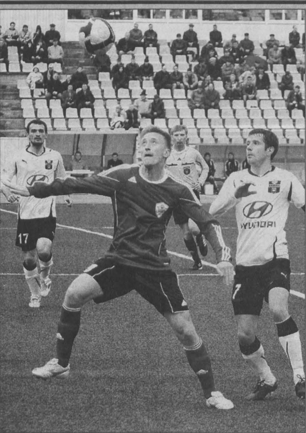
Футбол: Кубок ЛФК