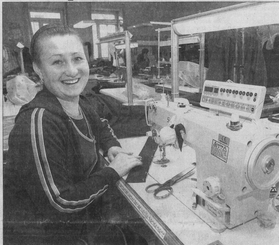
Общественные работы могут быть и в ателье по пошиву одежды.