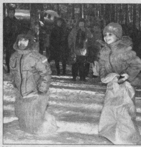
Масленица в «Томской писанице».

Промышленовцы посмотрели театрализованную программу, украшением которой стало выступление детского народного фольклорного коллектива «Жаворонушки». Юные жители района с удовольствием приняли участие в забавках – соревнованиях на буме, гиревом спорте, перетягивании каната, розыгрыше призов.