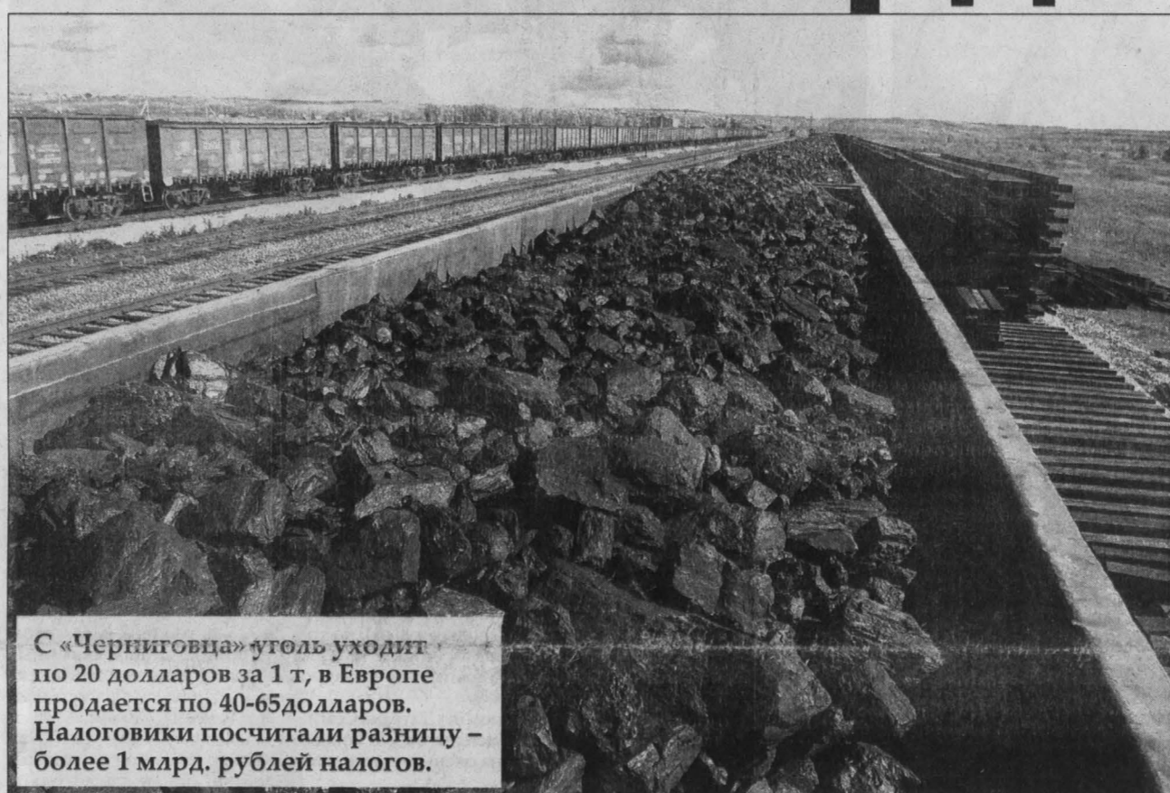
С «Черниговца» уголь уходит по 20 долларов за 1 т, в Европе продается по 40-65 долларов. Налоговики посчитали разницу – более 1 млрд. рублей налогов.

Суть дела вкратце такова. Инспекция, проверив разрез, в октябре прошлого года приняла решение «о привлечении к ответственности за совершение налогового правонарушения» в части доначисления налогов. И предложила уплатить: налог на прибыль в сумме 795,8 млн. рублей, налог с дохода, выплаченного иностранной организации (2,2 млн. рублей), налог на добавленную стоимость (10,4 млн. рублей), налог на доходы физических лиц (118,3 тыс. рублей), единый социальный налог (32,3 тыс. рублей). Сумма в 1 млрд. 192 млн. рублей (как видно из налогов – это поступления в федеральный, областной бюджеты и социальные фонды) получилась с учетом