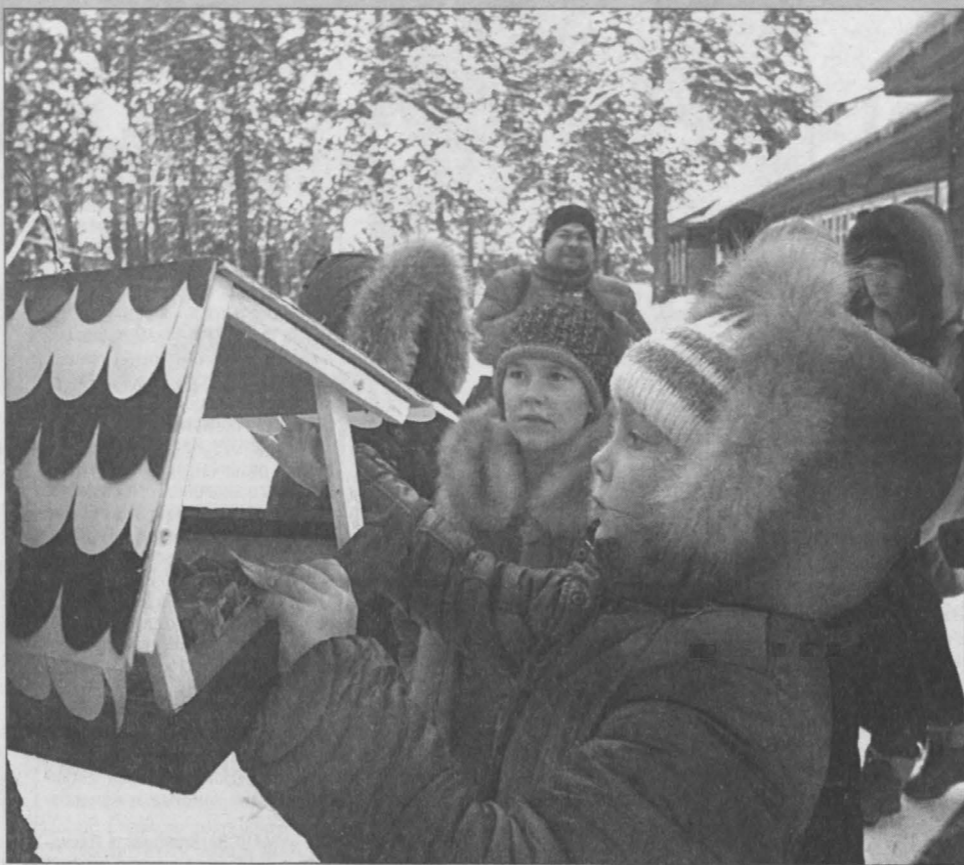
Фото Евгения Курскова.