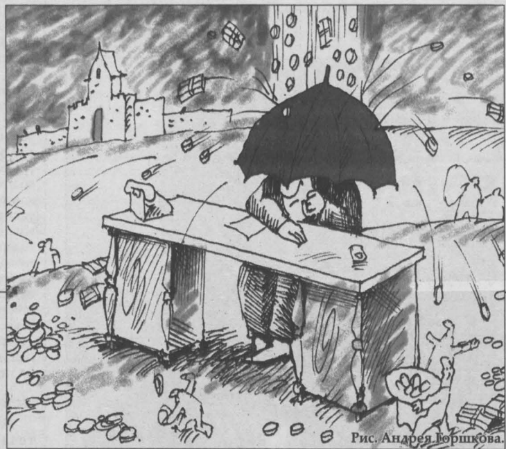
Рис. Андрей Борщова.

Вчера прошло всероссийское селекционное совещание, на котором обсуждались вопросы подготовки к зиме, сноса аварийного жилья и ремонта многоквартирных домов.