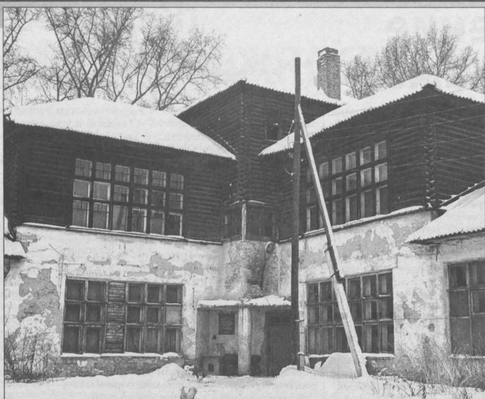
Голландскую сторону очень заинтересовала наша идея: отреставрировать здание бывшей школы на «Красной Горке», но разместить там не музей в привычном нам понимании этого слова, а «Российско-голландский культурно-образовательный центр».

определенных норм эксплуатации. Причем арендаторами могут выступать и жильцы, желающие жить в «старинном историческом доме», и фирмы, нанимающие помещения под свои офисы.