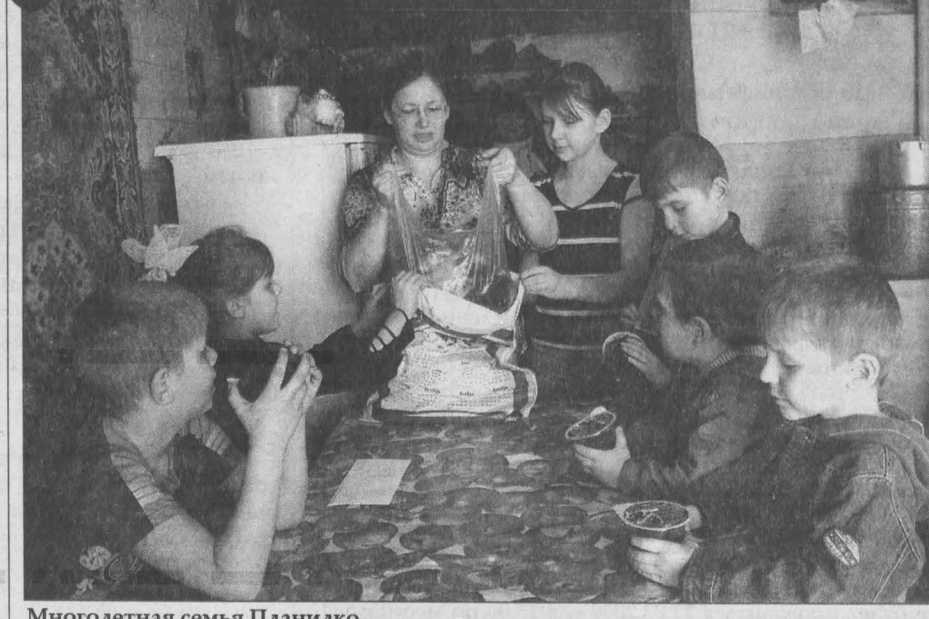
Многодетная семья Планидко.