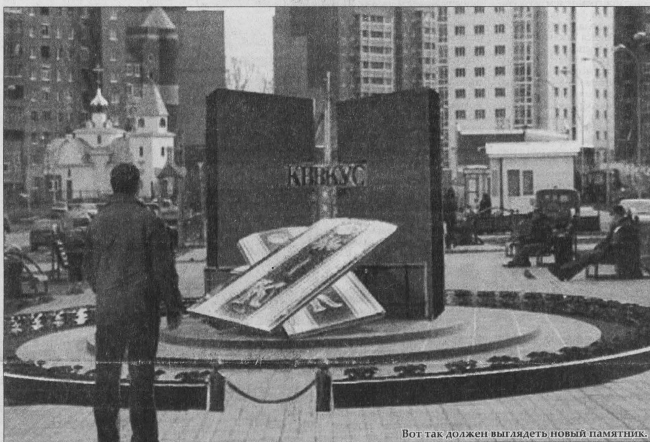
Вот так должен выглядеть новый памятник.