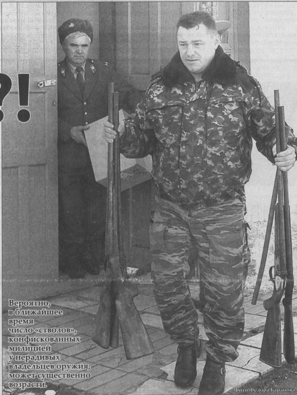
Вероятно, в ближайшее время число «стволов», конфискованных милицией у нерадивых владельцев оружия, может существенно возрасти.

Вопрос этот далеко не праздный. Только в Кемеровской области официально зарегистрировано около 99 тысяч «стволов»... В начале сентября, например, во дворе одного из домов по проспекту Ленинградскому в Кемерове пьяный мужчина среди бела дня устроил пальбу из своего охотничьего ружья по деревьям и голубям.