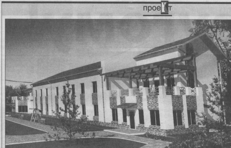
Так будет выглядеть социальная усадьба.