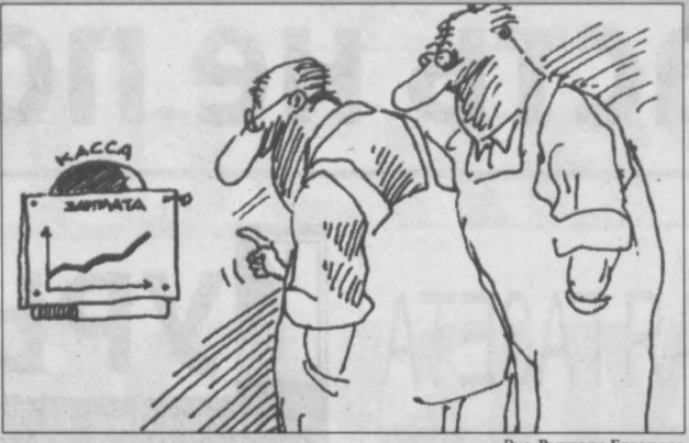
Рис. Виктора Богорада.

Новокузнецкие предприятия, имеющие задолженность по платежам в бюджет и по заработной плате, держали ответ за свои действия перед городским штабом по финансовому мониторингу.