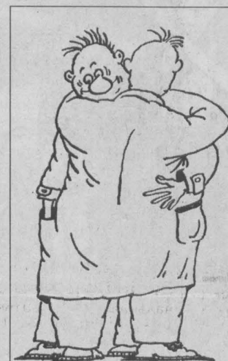
Рис. Леонида Мельника.

Кредитная организация обязана предпринять все предусмотренные законодательством Российской Федерации меры для взыскания задолженности.