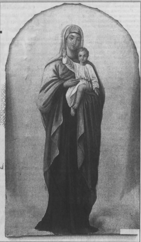
Чудотворная икона «Мать Божья с младенцем».