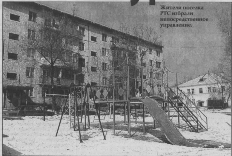
Жители поселка ГТС избрали непосредственное управление.