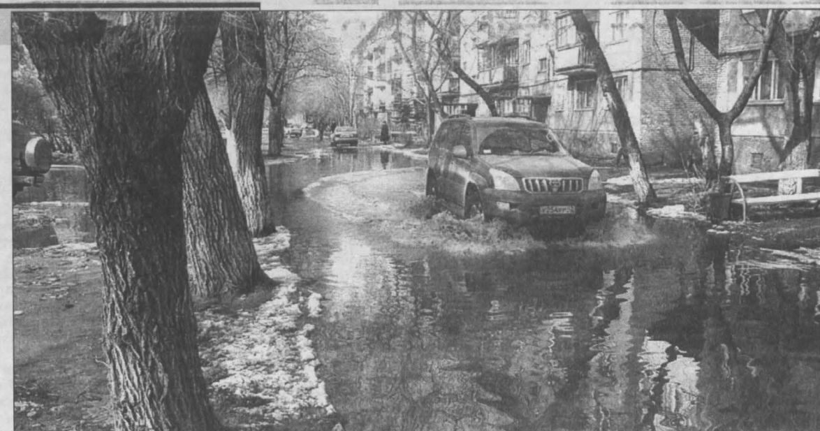
Во дворе в центре Новокузнецка наводнение уже началось.

В кинотеатре «Пламя», где по традиции должны размещаться эвакуированные, из мебели всего лишь два дивана. Есть проблемы и с организационной радиосвязью. Мобильники в такой ситуации не выручат. По словам представителей управления ГО и ЧС, в городе необходимо создать единую радиосеть оповещения. Пока не решен вопрос и с «полевой кухней», чтобы вовремя накормить пострадавших от паводка горячей кашей. Кстати, за «Кузнецкой крепостью» определено и место выемки глины для аварийного ремонта