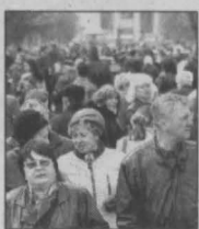
В программе ремонта должны участвовать деньги собственников жилья - не менее 5 процентов от объема капитального ремонта здания.

назад каждая вторая жалоба касалась проблем с теплом, то за последние два года такие обращения составили всего 5 процентов от их общего количества. Проведен большой объем работ по строительству и реконструкции тепловых и водопроводных сетей. За последние девять лет заменены 42 процента ветхих сетей, это 1700 километров, и 23 процента водоводов - 2 тыс. километров.