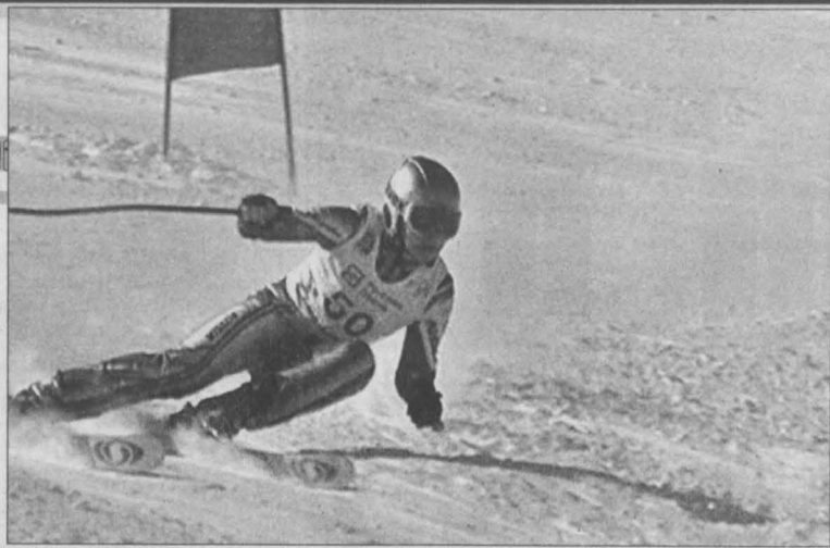
На трассе слалома-гиганта.

Тон задавали на этот раз воспитанники междуреченской и новокуюзнецкой горнолыжных школ. Они уже пробуют силы и в главной команде страны, принимали участие в