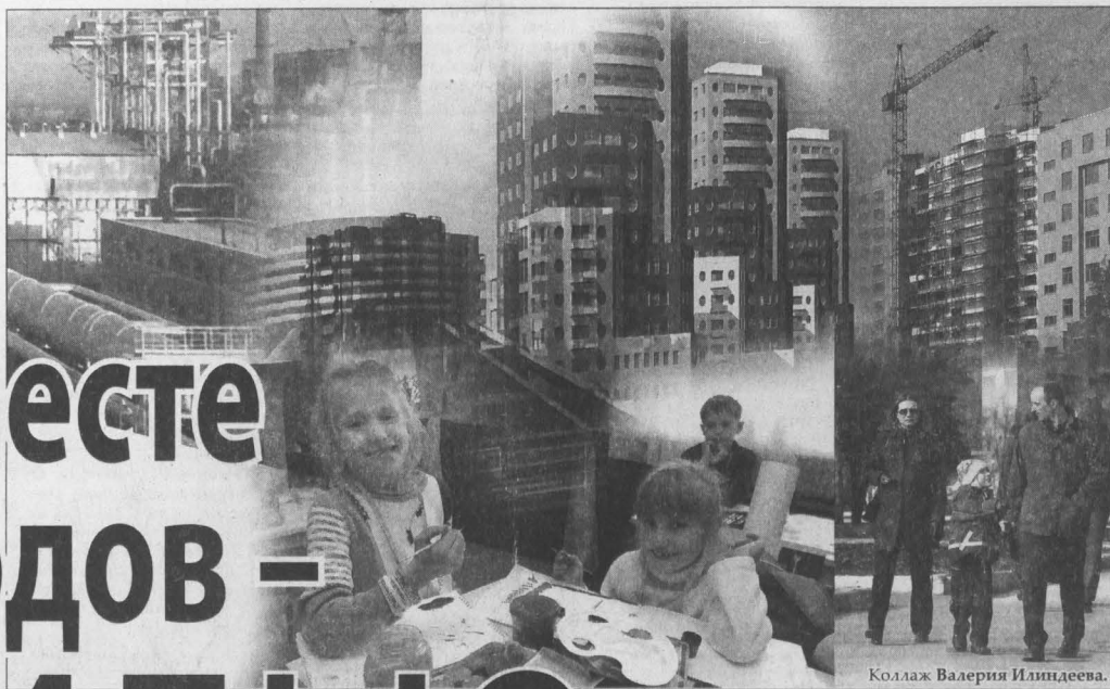
Коллаж Валерия Илиздева.

ности организации здесь выпуска полиэфирной кордной ткани — дорогой и перспективной продукции. Но от него, как и от идеи создания логистического комплекса, в итоге собственник отказался. Оба они требовали огромных вложений, а сроки окупаемости инвестиций либо были слишком длинными, либо даже «не просчитывались».