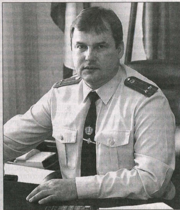
ИЗ ДОСЬЕ ОПОРЫ

рая организация, тем больше там сотрудников. Перед судебным приставом стоит задача не только взыскать долг, но и максимально сохранить работоспособность предприятия, чтобы эти люди не оказались на улице. Не так давно приставы Яйского района за долги по налогам и арендной плате арестовали пилораму одного из местных деревообрабатывающих предприятий. Пилорама у организации не единственная, поэтому она сможет