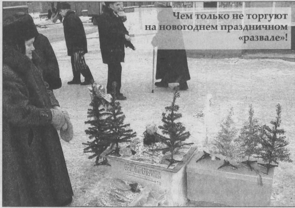
Чем только не торгуют на новогоднем праздничном «развале»!

Подобные «сувениры» были расценены как холодное оружие, которое запрещено и к торговле, и к ношению на территории Российской Федерации. Против хозяйки-китайки этой сувенирной новогодней продукции возбуждено уголовное дело.