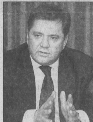
Сергей Шматко, министр энергетики.

На другое предложение угольщиков – снизить в период кризиса «аппетиты» железнодорожников при экспортных перевозках энергетического угля – ответ еще предстоит найти. Как рассказал «Кузбассу» один из участников совещания, сейчас оплата перевозок угля до портов, что на запад, что на