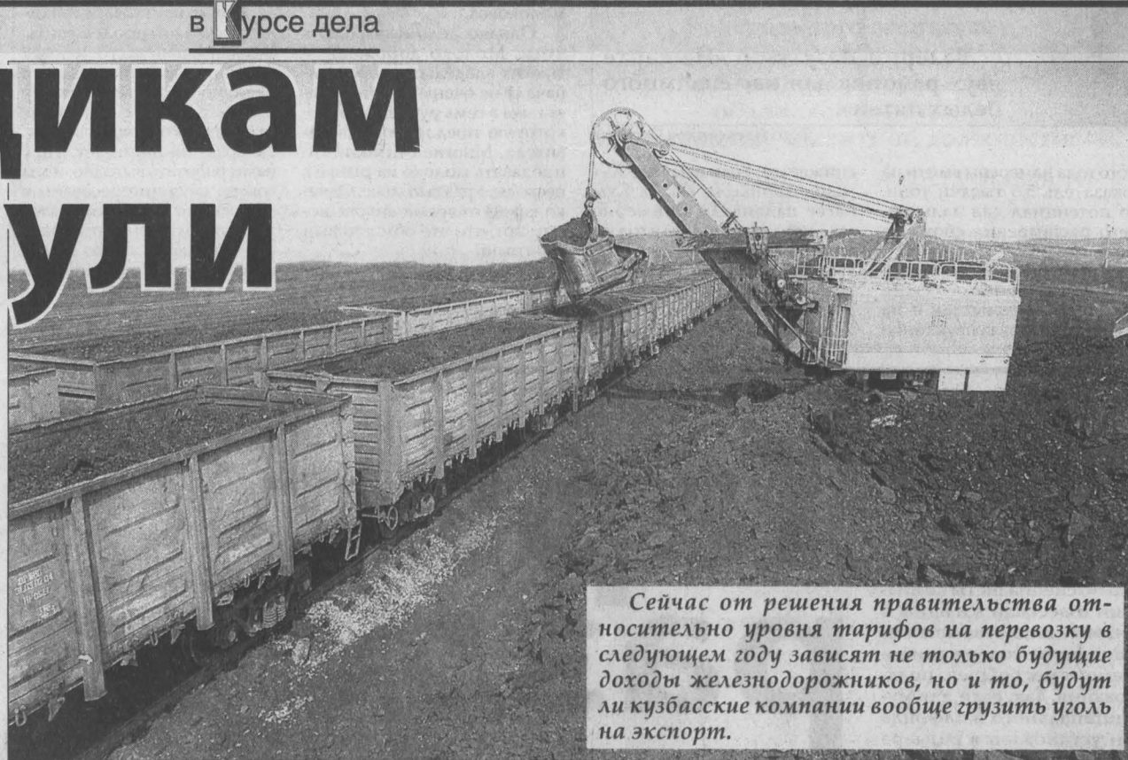
Сейчас от решения правительства относительно уровня тарифов на перевозку в следующем году зависят не только будущие доходы железнодорожников, но и то, будут ли кузбасские компании вообще грузить уголь на экспорт.