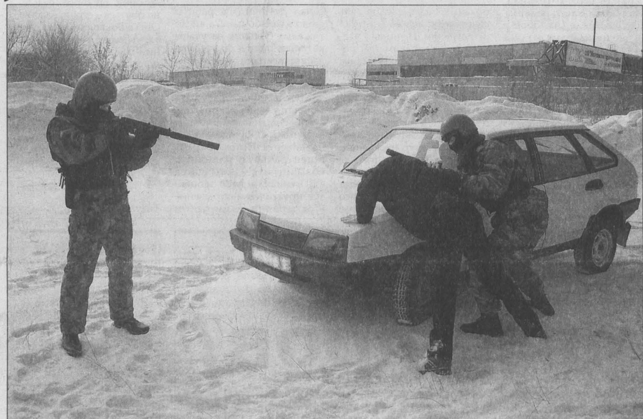
Нередко оперативные разработки сотрудников УБОПа заканчивались так.