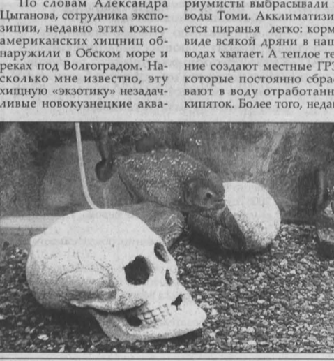
Панцирная щука. Кровожадные пирании.

В Новокузнецке с начала этого года появилось новое, весьма популярное среди новокузнецчан экзотическое развлечение. Это передвижная экспозиция «Подводный мир», прибывшая из Омска и расположенная в Новокузнецком краеведческом музее.