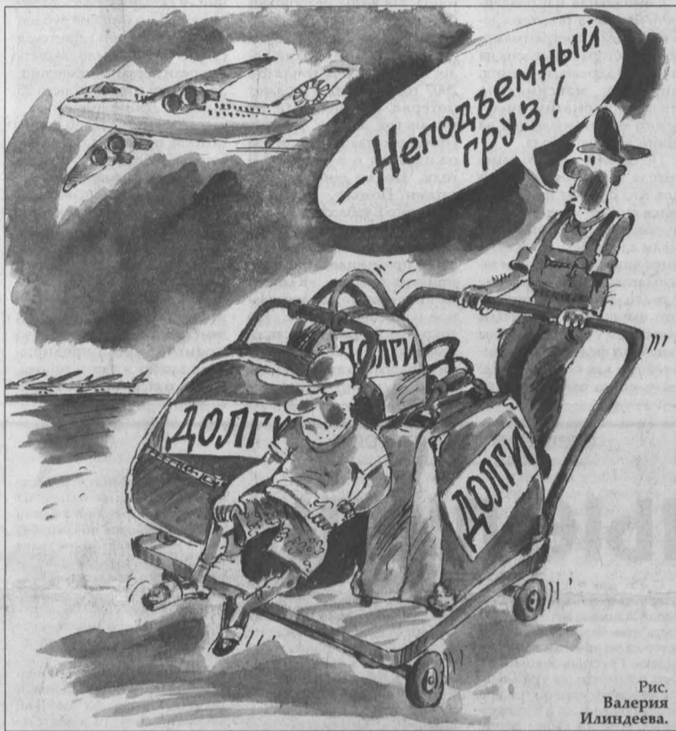
Рис. Валерия Илиндеева.

Но такая мера по взиманию долгов у отдельных недобросовестных граждан никак не регламентировалась нашим законодательством. И потому приставам приходилось использовать для этого другой федеральный закон, касающийся порядка выезда и выезда с территории России. Одна из его статей предусматривала, что гражданина можно не выпустить за рубеж, если он злостно уклоняется от исполнения наложенных на него судом обязательств. Однако это были единичные случаи. Да и они не всегда находили понимание у представителей отечественной Фемиды, которые порой считали, что ограничивать свободу передвижения человека судебные приставы попросту не имеют права. И, как следствие, отменяли соответствующие постановления судебных приставов, разрешая тем, кто задолжал в ту же казну сотни тысяч рублей налогов (или, например, злостным алиментщикам, не жела-