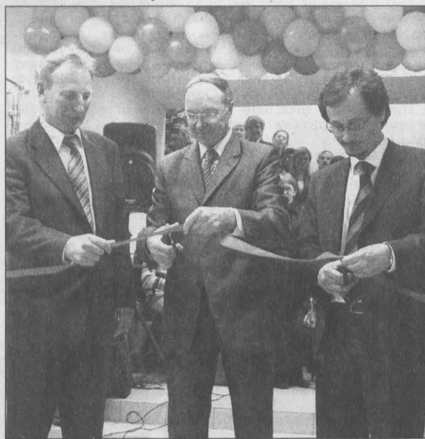
Красную ленточку перерезали в торжественной обстановке.