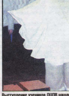
Выступление учеников ОЦПВ школы Никольского собора.

После чаепития, вручения награды, проведения викторины детям