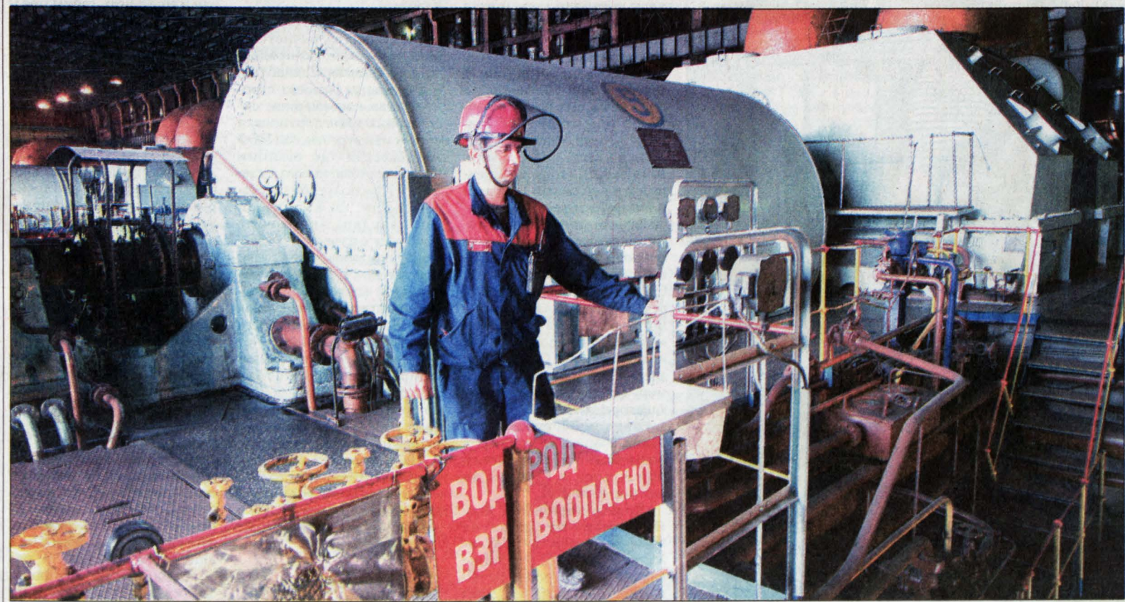
Машинный зал Томь-Усинской ГРЭС.