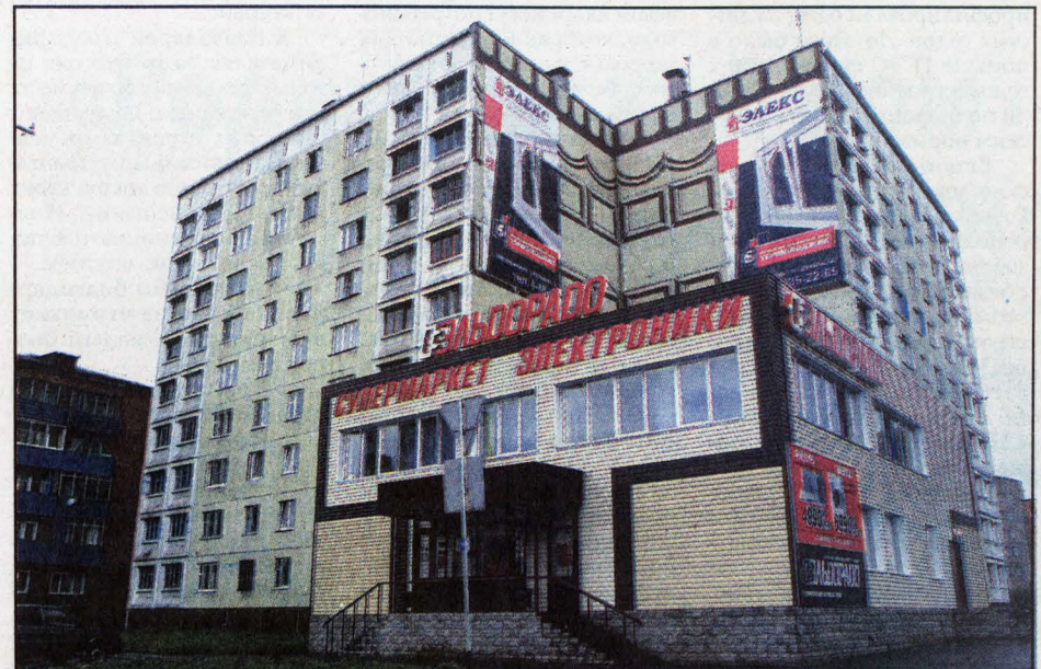
Мыски осваивают крупные торговые компании.