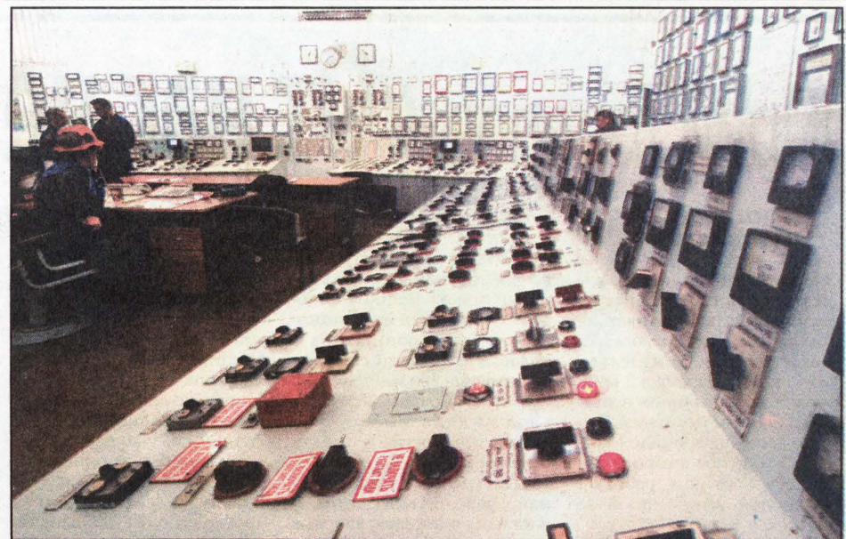
Пульт управления Томь-Усинской ГРЭС.