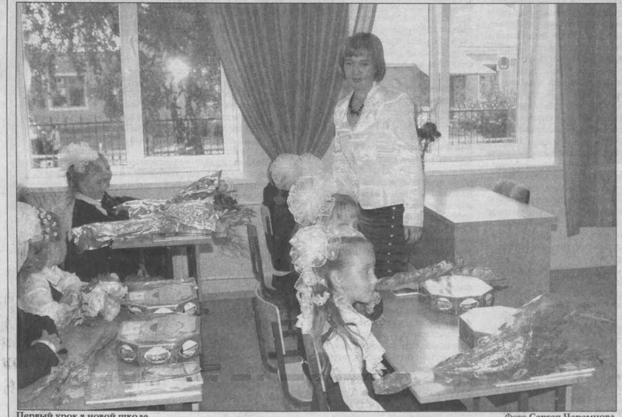
Первый урок в новой школе.