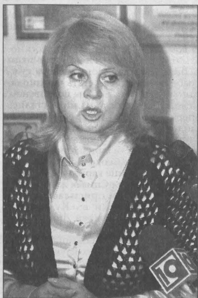
Председатель попечительского совета фонда «СУЭК - регион» Э.А.Памфилова.