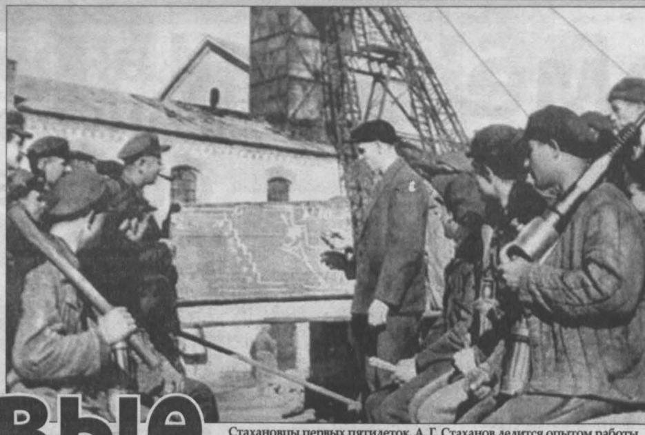
Стахановцы первых пятилеток. А. Г. Стаханов делится опытом работы.

В фонде Госархива Кемеровской области сохранилось множество уникальных документов о первых шагах стахановского движения на земле Кузнецкой.