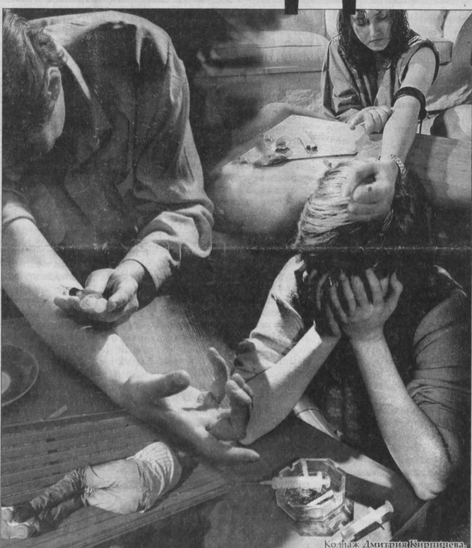
Коллаж Дмитрий Кирильченко

Ученые утверждают, что современные лекарственные препараты очень эффективны в борьбе с ВИЧ/СПИДом и что благодаря им болезнь теперь можно считать не смертельной, а хрониче-