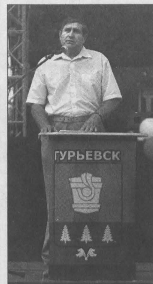
дург» сможет принять теперь гораздо больше любителей спорта, чем раньше.

ваны женская консультация, кабинет флюорографии в поликлинике, приобретен цифровой флюорографический аппарат. Причем, есть теперь и передвижной флюорограф, который используется прямо на предприятиях. Еще одно нововведение: в 2006 году у нас открылись два дома общерабочей практики на окраинах Гурьевска в частном секторе, приблизив тем самым медицинское обслуживание к жителям. В этих же помещениях - квартиры для медработников. Есть там и дневной стационар, можно пролечиться рядом с местом жительства. - Здоровье горожан - вопрос важнейший. Но не менее важно при этом, где и как они обучаются, отдыхают? - Проблем и здесь хватает, но тоже стараемся решать их. В этом году приступаем к строительству новой школы в Горно-рудном районе Гурьевска, планируем строительство пристройки к школе № 11, где разместится столовая и актовый зал. Уже ведутся проектные работы по строительству детсада на 170 мест. Особое внимание уделяем детским дворовым площадкам, стараемся ежегодно обновлять их. Недавно начала действовать большая спортивная площадка в квартале 6-7. А открывшийся после капремонта спортивный зал в спорткомплексе «Метал-