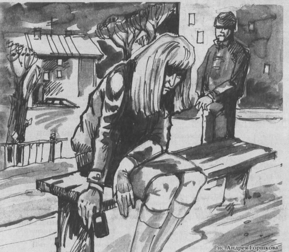
Рис. Андрея Горикова.