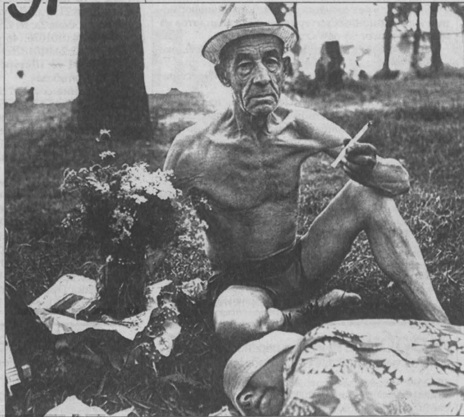
«Сам по себе портрет обязательно предполагает окружение. Вот на пляже у тебя же нет никакого окружения. Так какая тебе разница — пианино у тебя за спиной или нет?!» — смеется Бахарев.

На первый взгляд, многие работы Бахарева могут показаться однообразными. Стены занимают снимки натурщи на одном и том же диване — разные позы, разные эмоции, на них и начинаешь заострять внимание. «А вот стояла бы у нее за спиной пианино», — расуждает кто-то.