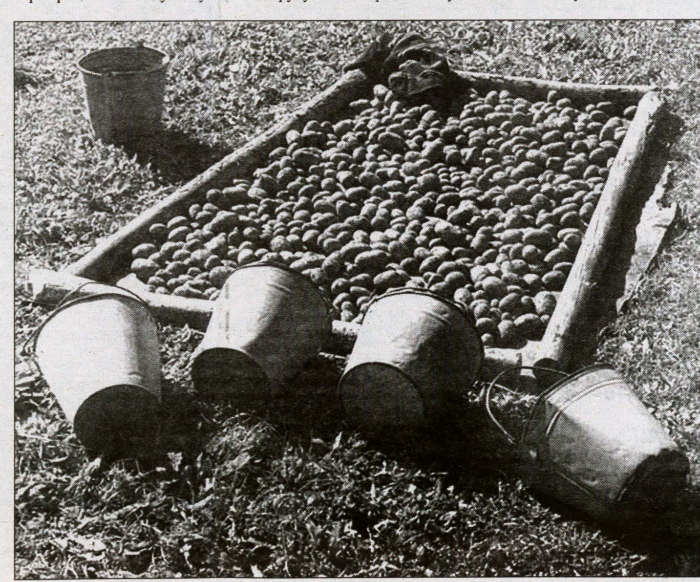
Самое сложное — сделать картофель экономически выгодным.

Но раз картофель в дефиците его, должно, быть выгодно выращивать? — Да, в 2007 году цена была сумасшедшая — 20 рублей за килограмм. В результате мелкие фермеры кинулись в картошку, началось перекуп старейшей техникой, расхватали ее семена... Результат? Достойной цены на картофель в этом году не будет.