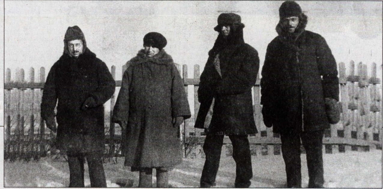
Американские «сибиряки». 1924 г.

Приметы: Петр Поворот, Капустник, Солнцеворот, Петр Афонский. С Петра Афонского солнце на зиму, а лето на жару. Солнце укорачивает ход, а месяц идет на прибыль. Выпадают большие росы. Запоздалый капустник: последний посев огурцов и посадка рассады капусты. Последний сев поздней гречи. В этот день родились: 1937. Альберт Филозов, заслуженный артист РСФСР. События: 1969. Образована группа «Машина времени». В этот день ушли: 1997. Жак Ив Кусто, французский океанограф, изобретатель акваланга, автор фильмов «Подводная одиссея Кусто».