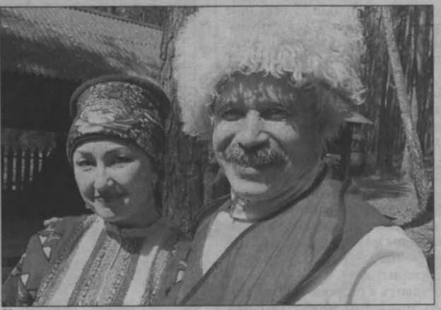
Казачка и казак.

В кемеровском музее-заповеднике «Томская писаница» отметили праздник Троицы. Святая Троица — праздник христианский, православный, считается, что в этот день Святой Дух сошел на апостолов. Однако — как водится на Руси — праздник Троицы органично наложился у нас на языческий — зеленые Святки — цикл летних празднеств, связанных с почитанием духа растений. Так и празднуют их вместе, не деля особо христианских традиций и языческих. А еще Троица — издревле один из самых любимых праздников казачества. Потому и решили на Троицу казаки устроить здесь пятый фестиваль казачьей культуры. Так что собрались в Писанице и священнослужители, и бабушки со свечками и иконками, и разудалые казаки, и парни с девками в древнеславянских одеждах, и еще много-много всякого разного народа. Так что праздник получился пестрым и красочным.