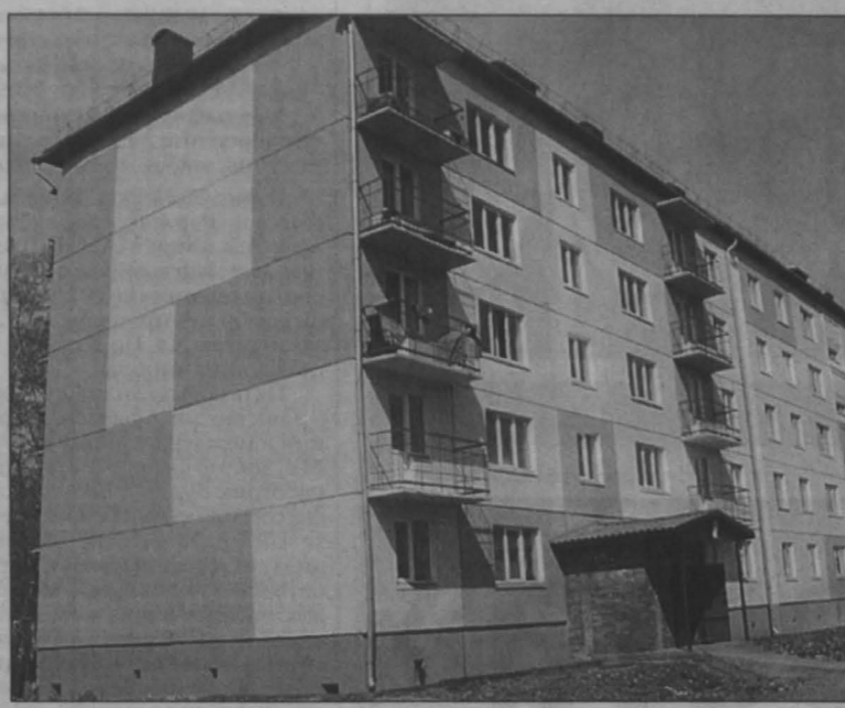
Новый дом по ул. Дзержинского, 59.