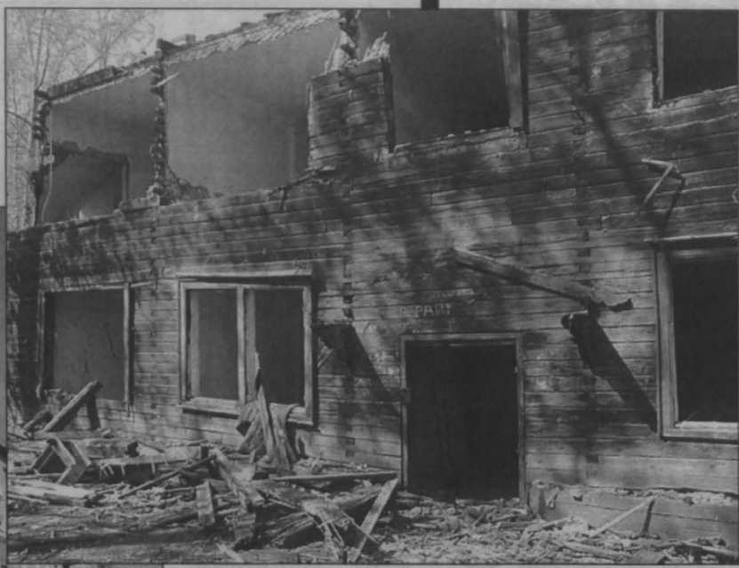
Ветхие бараки 30-х годов прошлого века – под снос.