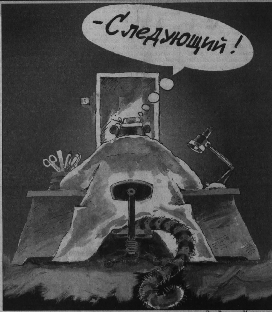
Рис. Валерия Илландеева.

Вот только хамство остается мало управляемым. И народ по-прежнему звонит и пишет в газету, надеясь, что обидчиков хотя бы «пригвоздят», предав их имена огласке. Но публиковать такие письма без проверки редакция не имеет права. Проверить же их практически невозможно: чаще всего инциденты случаются без свидетелей.