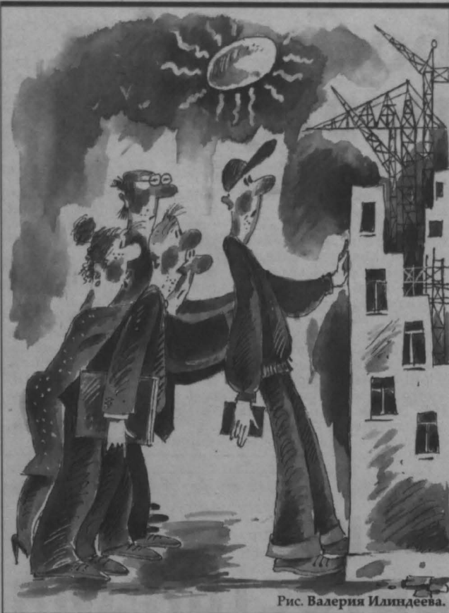
Рис. Валерия Илландева.

Проблему подготовки и трудоустройства рабочих кадров на рынке труда в г. Кемерово обсудили участники круглого стола в областном центре профессиональной ориентации молодежи. Тема эта не новая и весьма актуальная, поскольку социологи прогнозируют падение числа выпускников в Сибирском федеральном округе на 50 тысяч в год.