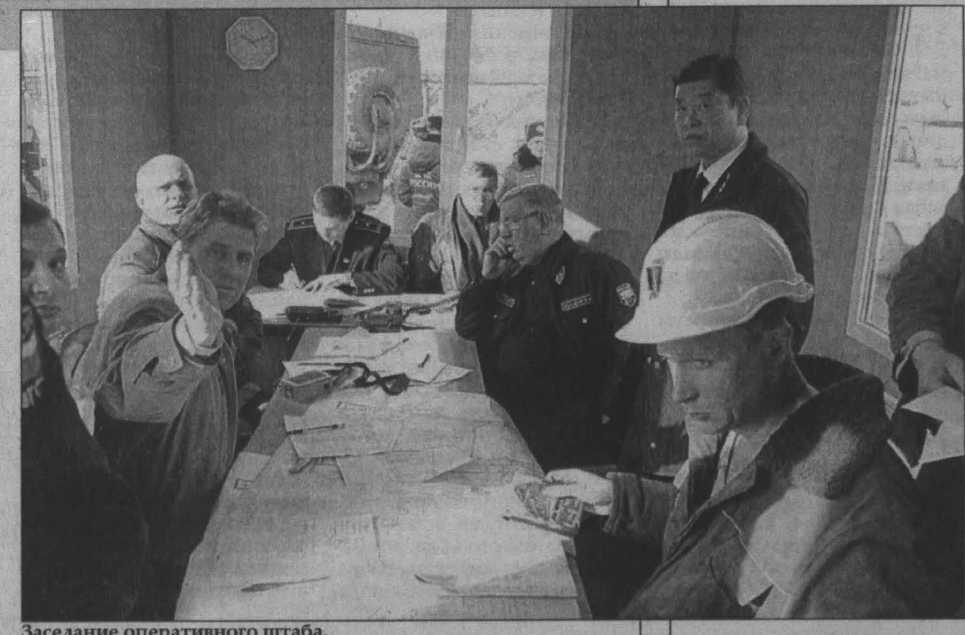
Заседание оперативного штаба.

Поисково-спасательные работы продолжаются. По данным областного штаба по проведению спасательных работ, который возглавляет губернатор А.Г.Тулеев, на это время спасено 93 человека, двое из них травмированы. Число погибших составляет 104 человека. Судьба 6 горняков остается неизвестной. Как сообщил министр МЧС С.К.Шойгу, комиссия