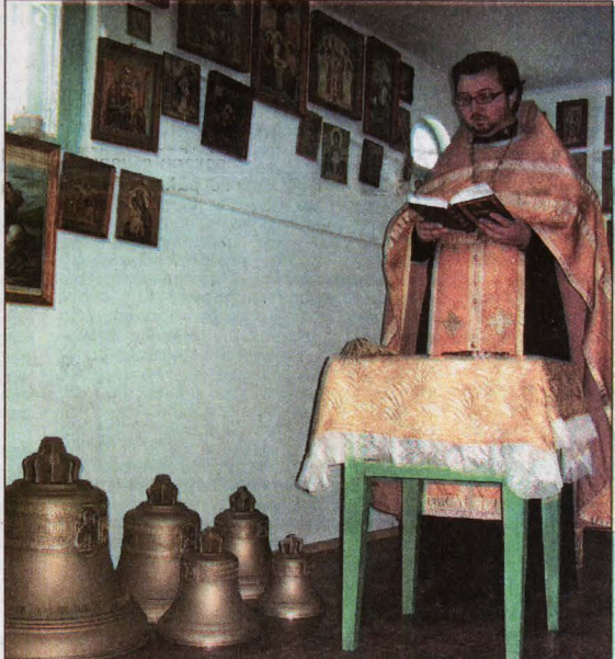
Звонница Никольского храма села Арсеньевка Кемеровского района к празднику Рождества Христова обретет свой голос.