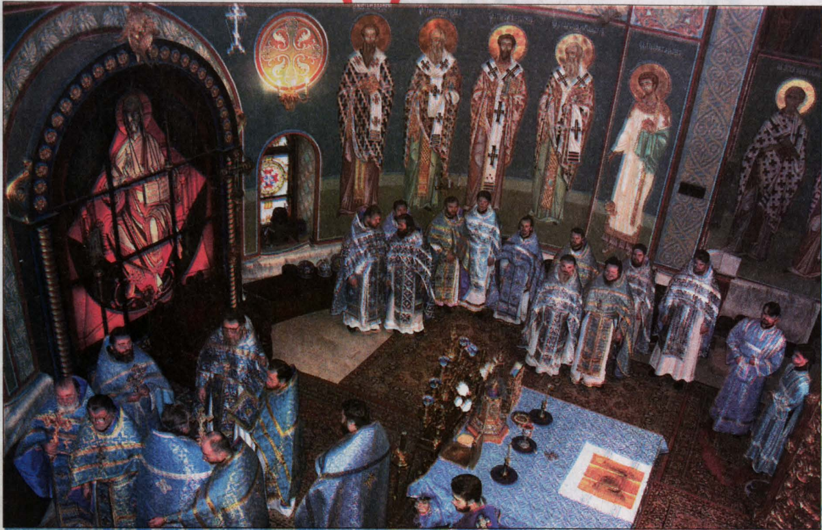
Божественная литургия в Знаменском кафедральном соборе в день празднования иконы Божией Матери «Знамение», 10 декабря.