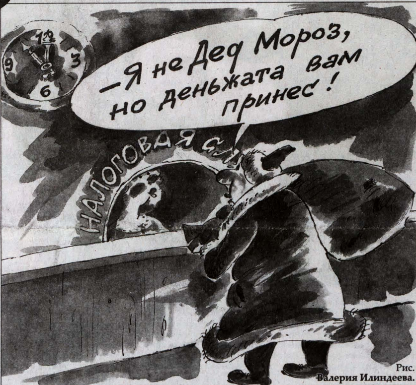
Рис. Валерия Илинцева.