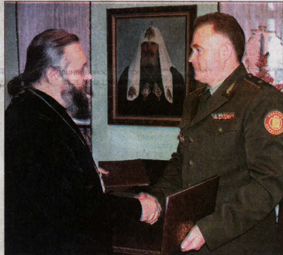
Подписание соглашения о сотрудничестве между Кемеровской епархией и Военным комиссариатом Кемеровской области.