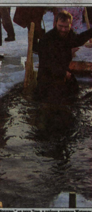
«Иордань» на реку Томь в районе деревни Журавли.

Цирковое представление Мстислава Западного для воспитанников воскресных школ области состоялось 19 января в государственном цирке Кемерово. Инициатором благотворительного праздника для детей явился глава региона Аман Тулеев. Посмотреть уникальный спектакль съехало около 1600 ребят со всего Кузбасса. После просмотра дети получили сладкие подарки от губернатора. От имени Амана Гумировича М. Западнему был вручен орден «Ключ Кузбасса».