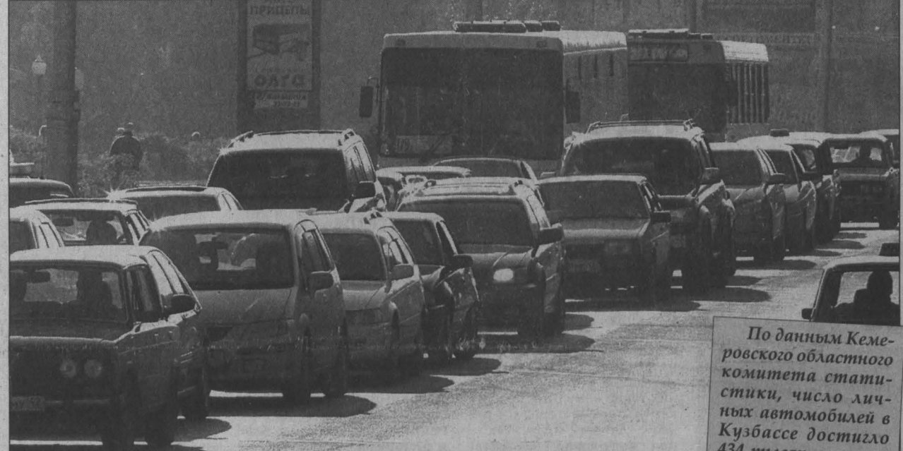
Небезопасные перекрестки: Октябрьский — Терешковой, Терешковой — Ленина, Сибиряков-гвардейцев — Кузнецкий, Дзержинского — Ленина, Пролетарская — Сарыгина, Красноармейская — на всем протяжении.

потоков. Двухуровневая развязка планируется и на проспекте Молодежном (ФПК), через железную дорогу с выходом на улицу Юрия Двужильного. На одно из последних предложений пока нет ответа, но мы предлагаем демонтировать трамвайную линию на пр. Кузнецком + от пр. Советского до ул. Калинина. И сделать в районе стадиона «Химик» стоянку для 400 единиц транспортных средств (для посетителей стадиона). В ближайшее время будет восстановлен подземный пешеходный переход на Кузнецком проспекте (около КЭМЗ) с жестким, достаточно высоким ограждением, что обеспечит пешеходов. Демонтировать трамвайные линии, за счет чего расширить проезжую часть, мы предлагаем и на улице Ноградской (пр. Кузнецкий до ул. Кирова). И на улице Дзержинского — от ул. Ноградской до пр. Ленина. Здесь будут демонтированы только две трамвайные остановки, но проезжая часть увеличится до 6 полос. Сейчас рассчитывается пассажиропоток, изучается возможность заменить трамвай троллейбусом. Это разгрузило бы центр города. Улица Соборная уже увеличивается до 4 полос. Столько же полос для движения транспорта будет на перекрестке ул. Инициативная — шоссе Егорова. Сотрудники ГАИ советуют: за рулем нужно ехать спокойно, не торопиться, не психовать. Наталья ЕВГРАФОВА.