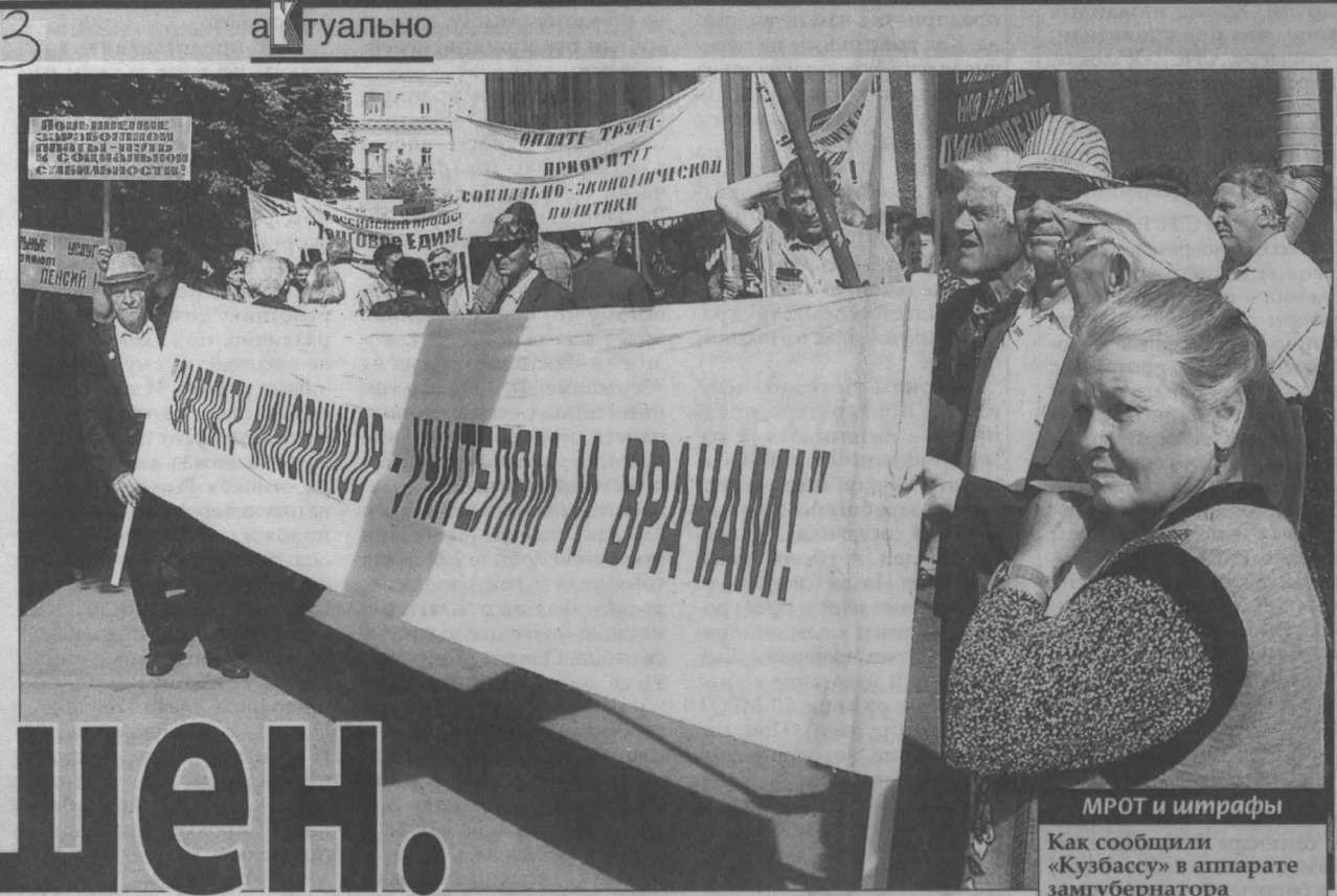
МРОТ и штрафы

С 1 сентября в России в 2,3 раза — до 2300 рублей увеличен минимальный размер оплаты труда (МРОТ). Правительство и дальше обещает повышать этот размер так, чтобы к 2011 году МРОТ был доведен до уровня прожиточного минимума. Министр финансов РФ Алексей Кудрин заявил, что в федеральном бюджете на 2008-2010 гг. на это увеличение (зарплата федеральным бюджетникам, прежде всего) зарезервированы дополнительные средства: 16 млрд. рублей — в 2008 г., 40 млрд. рублей — в 2009 г. и 53 млрд. рублей — в 2010 г.