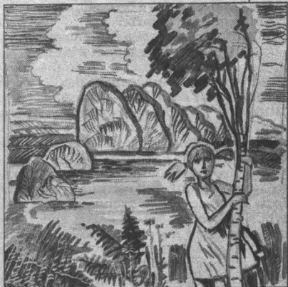
Рис. Андрей Горшков.

Всю рощу шатает от гудя! Сегодня со мной тебя нет, но вижу: мерцаешь ты всюду, куда простирается свет.