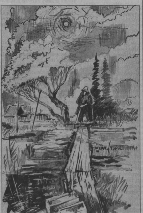
Рис. Андрея Горшкова.

Зеленые травы земли заплетают в прокосы, и по сердцу этот привычный несуетный труд, когда все неглавное в сторону ветер относит и мысли неспешно вдоль жизни текут и текут.