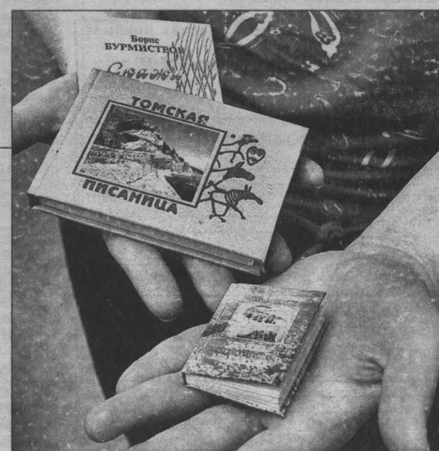
Книжечка-миниатюра «Томская писаница».