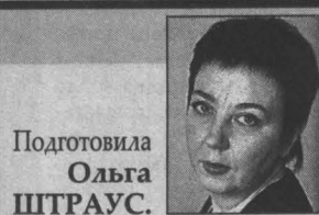
Подготовила Ольга ШТРАУС.

Скошет о том, как на одном из крытых рынков Кемерово демонтировали игровой автомат, на днях обошел все СМИ. Жены и матери вздохнули с облегчением: ну, наконец-то власти предприняли реальные шаги! Может, сейчас от заразы по имени «игромания» детей и мужей исцелить будет легче?