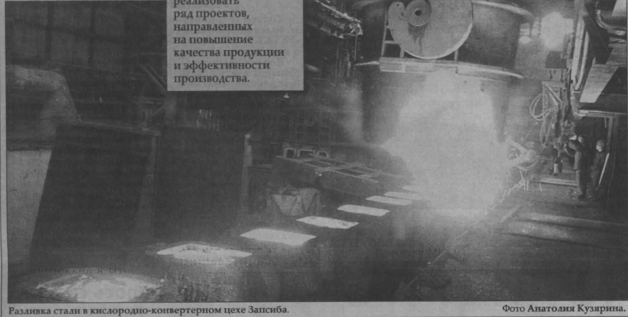
Разливка стали в кислородно-конвертерном цехе Запсиба.