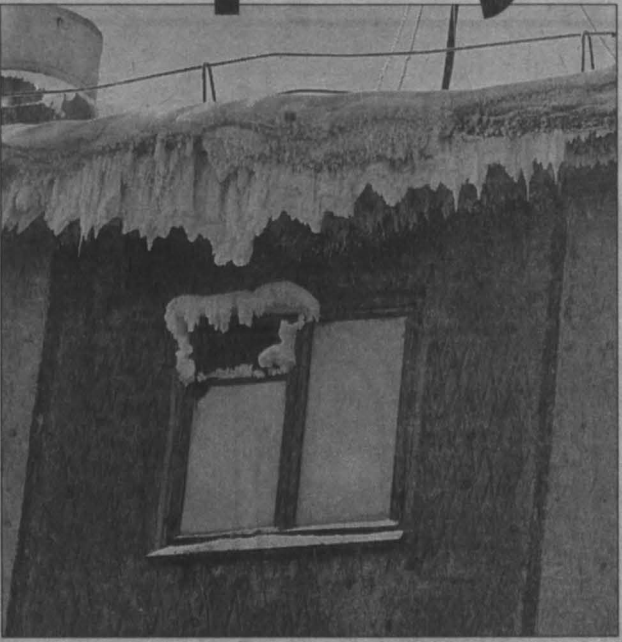
С декабря прошлого года на телефон горячей линии (31-23-32) администрации г. Кемерово позвонили более 145 горожан.