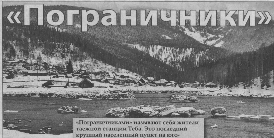
«Пограничниками» называют себя жители таежной станции Теба. Это последний крупный населенный пункт на юго-востоке Кемеровской области. Дальше, за Лужбой и рекой Казыр, начинается Хакасия. И все поезды и электрички, которые здесь проходят, относятся уже не к Западно-Сибирской, а к Красноярской железной дороге. Другого пути, кроме как по железной дороге, в Тебу нет.

В школе сегодня 101 ребенок. Все классы есть, правда, наполняемость их разная. Так, в 11-м классе 11 человек, в десятом – семь, в пятом – четыре. В первый класс нынче пойдут 12 детей.