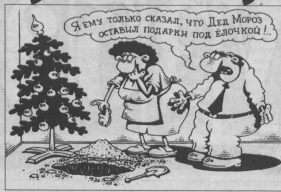
Рис. Игоря Кийко.

– Это действительно очень тяжелый труд – работа в новогодние праздники, – делится вокалист Музыкального те-